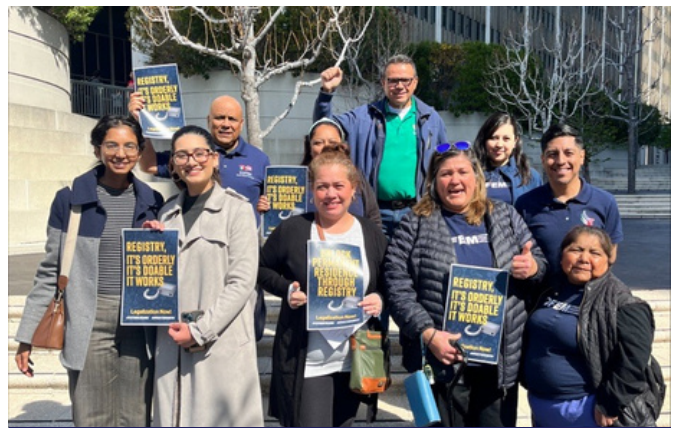
COFEM y CAIR-GLA en una reunión organizado por CHIRLA