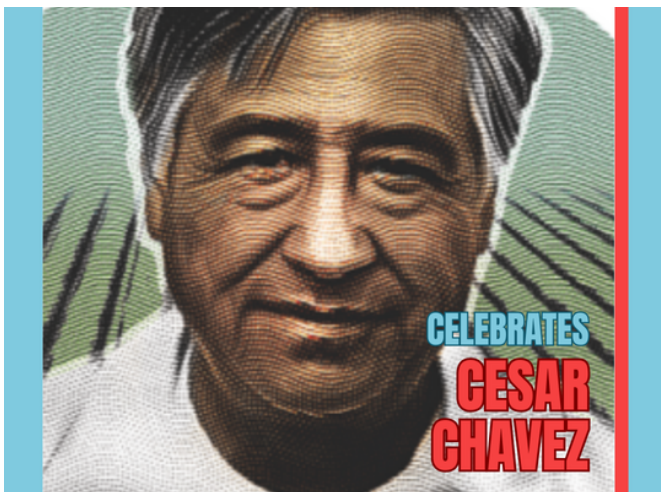
Publicación de IRLA sobre el Día de César Chávez