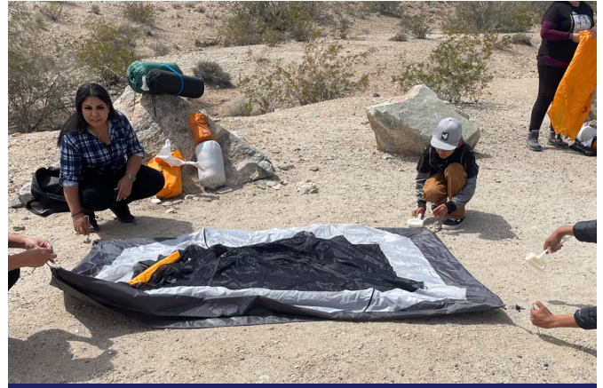
Montaje de las tiendas de campaña

El día 11 de marzo el equipo de conservación llevó un grupo de participantes, incluyendo algunos de sus promotores a el sendero de Mastodon Trail que se encuentra dentro del parque nacional de Joshua Tree. El grupo caminó un total de 2.6 millas donde tuvieron el gusto de gozar la naturaleza, la vida silvestre y flores silvestres nativas en el área. El equipo también tuvo tiempo de compartir sobre la importancia de la salud mental al aire libre y como nos beneficia salir y sumergirnos en la naturaleza. Al igual, los participantes también tuvieron el honor de escuchar música en ukelele en vivo y conectar los beneficios entre la música y la naturaleza.