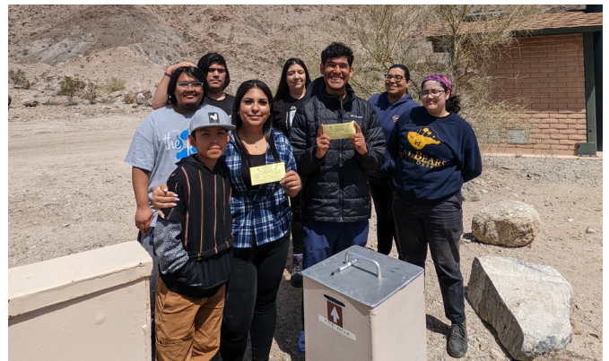
Día de senderismo en el Parque Nacional Joshua Tree.