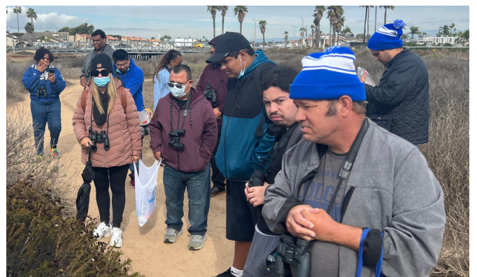
Visita de campo para personas con discapacidades mentales

El 2 de noviembre, COFEM y Nature for All llevaron a 13 adultos con discapacidades mentales a la reserva ecológica de Bolsa Chica para aprender sobre los animales que viven en la zona y a disfrutar de la naturaleza.