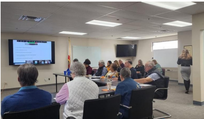
"Coffee with", junta mensual de la fundación de RAP (pt. 1)

El 28 de noviembre, COFEM, en colaboración con Visión y Compromiso, visitó la localidad de Thermal donde se llevó a cabo el 3er taller de la serie Hablemos Sobre Salud Mental. El tema central del taller fue la depresión, sus características, métodos de prevención y estigma. Tuvimos la oportunidad de charlar con más de 15 miembros de la comunidad incluyendo adultos y adolescentes, contestar sus preguntas y proveerles información acerca de los recursos locales disponibles.