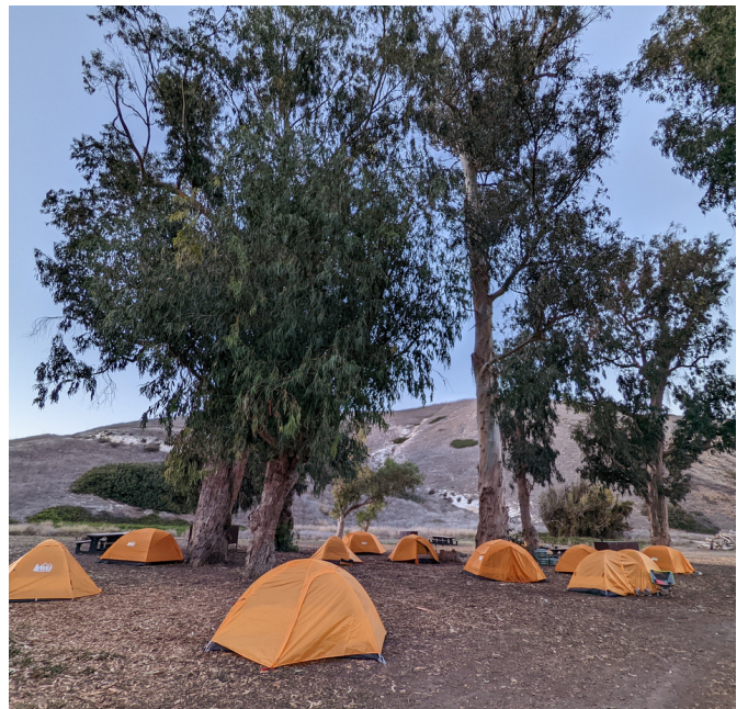
Sitio de campamento en el Parque Nacional Channel Islands

oportunidad para meditar, escribir un diario y disfrutar de las impresionantes vistas.