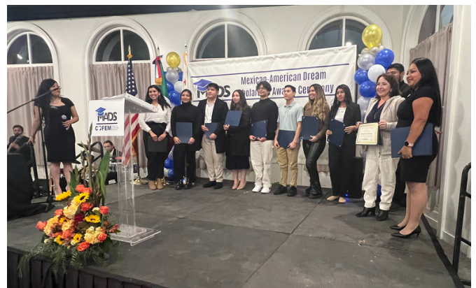
Beneficiarios de la Beca del Sueño México-Americano

En 2023, COFEM espera aumentar el monto de sus becas, que actualmente tienen un valor de $500 o $1,000, y ayudar a los estudiantes inscritos en programas de maestría.