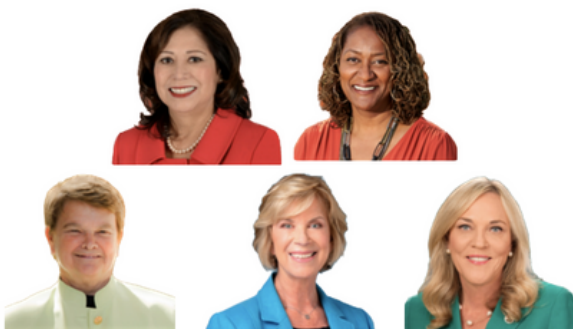
Junta de Supervisoras del Condado de Los Ángeles