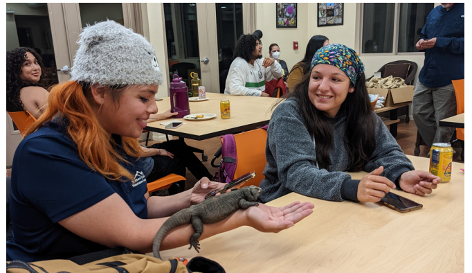
Estudiantes de Nuestro Desierto con un chuckwalla