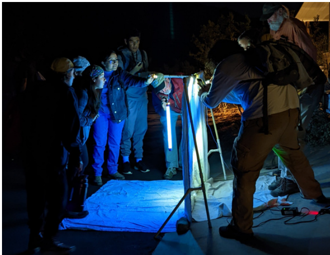
Estudiantes de Nuestro Desierto teniendo encuentros con animales nocturnos

aprender sobre el trabajo de los científicos que trabajan allí. Los estudiantes también aprendieron más acerca de la importancia cultural, geológica e histórica del cañón.