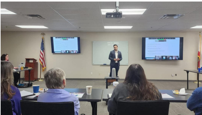
"Coffee with", junta mensual de la fundación de RAP (pt. 2)