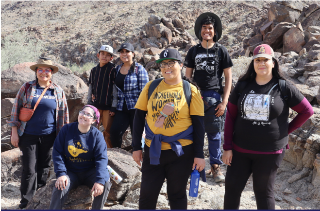
Estudiantes de Defensores de Tierras Públicas en Corn Springs

California Native Plant Society y Sierra Club para la Subsecretaria de Relaciones Exteriores y Subsecretaria de Biodiversidad y Hábitat de la Agencia de Recursos Naturales de California.